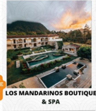
LOS MANDARINOS BOUTIQUE & SPA

$185.00 POR PERSONA POR NOCHE MÍNIMO 2 NOCHES